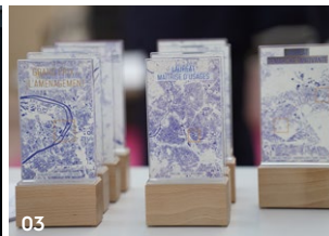
01_ Le Congrès de l'UNAM / 02_L'Assemblée générale / 03_Les trophées de l'aménagement